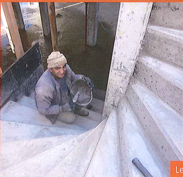
Les finitions du gros œuvre SOTRAVEST